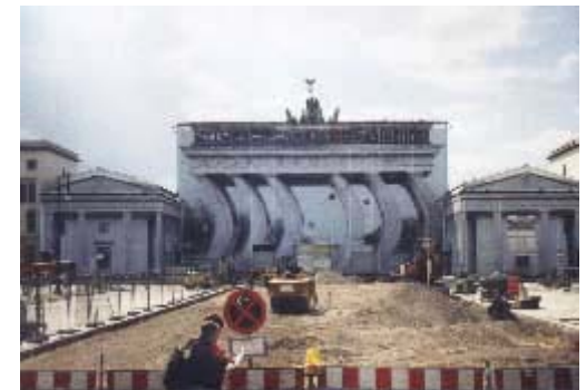
Das Brandenburger Tor während der Renovierungsarbeiten 2002