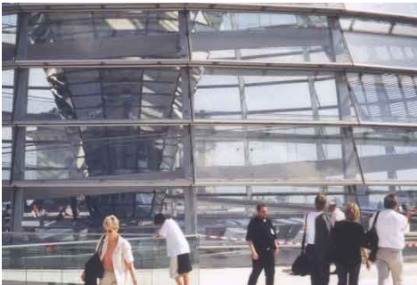
Die neue Kuppel des Bundestages auf dem Reichstagsgebäude.

Zusätzliche Informationen auf Nachfrage !