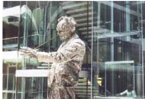
Willy-Brandt-Skulptur im Foyer des SPD-Hauses in Berlin-Kreuzberg.