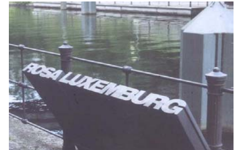
Denkmal für die im Berliner Tiergarten ermordete Rosa Luxemburg.